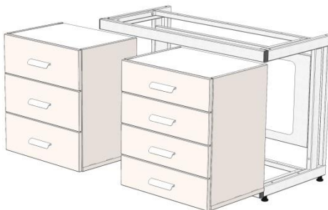
Рис. 1. Установка высоких тумб на каркас